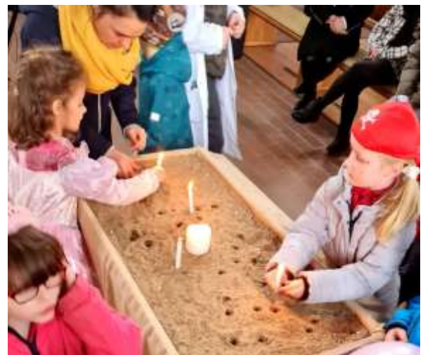
Kinderfasching im Kirchsaal und Kerzen als Hoffnungszeichen gegen die Angst.

Vom 9. Mai bis 31. Mai fällt die Christenlehre sowie die Kinderkirche am Samstag aus. Ich fahre mit meiner Tochter zur Kur.